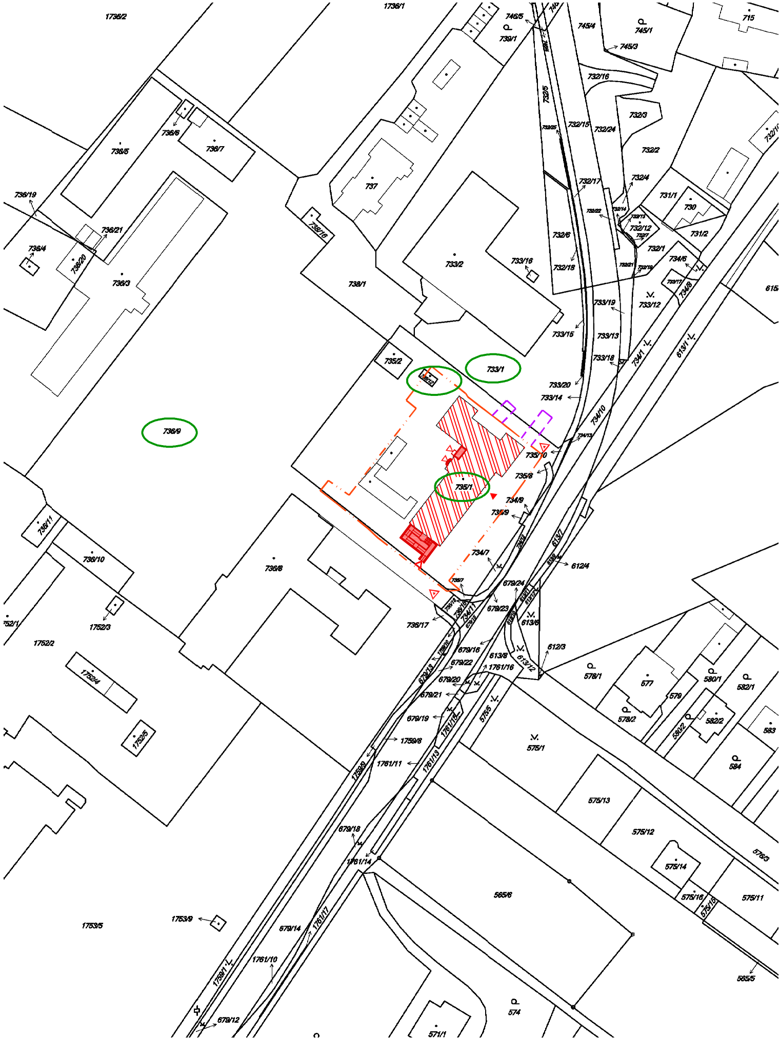
TABULKA č. 1 – druhy a parcelní čísla dotčených pozemků: Obec Lednice (584631), katastrální území Lednice na Moravě (679828)