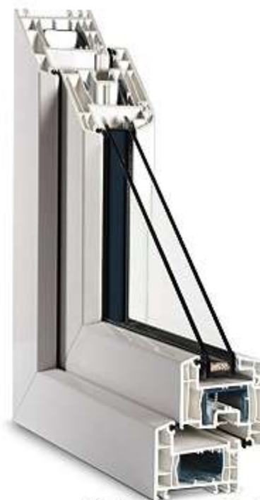
Obrázek je pouze ilustrativní.

Jak nejvíce ušetřit s novými okny? Porovnejte si parametry oken na zadní straně této nabídky.