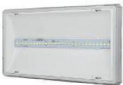
typ svítidla N

Typ A svítidlo LED přisazené kruhové Ø375, nestmívatelné, 1x27W, zdroj 700mA, 6x12 LED, opálový kryt, IP44, 2400lm, 4000K, rozměry Ø375 x 108, např. BRSB4KO375V2/ND