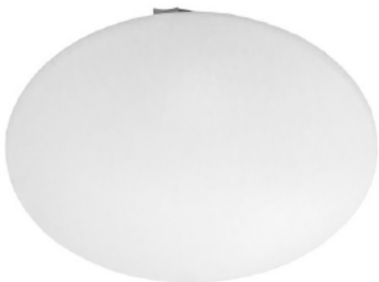
typ svítidla A