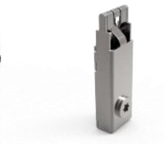
obr. 05 – aretační zámek svislé výztuhy