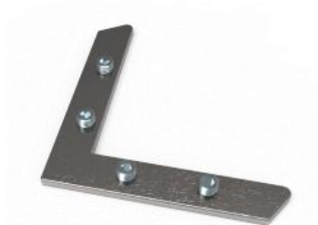
obr. 03 – rohová ocelová spojka