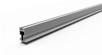
obr. 02 – hliníkový profil