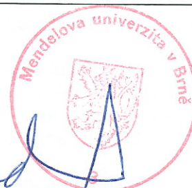
prof. Ing. Danuše Nerudová, Ph.D. Rektorka - Mendelova univerzita v Brně